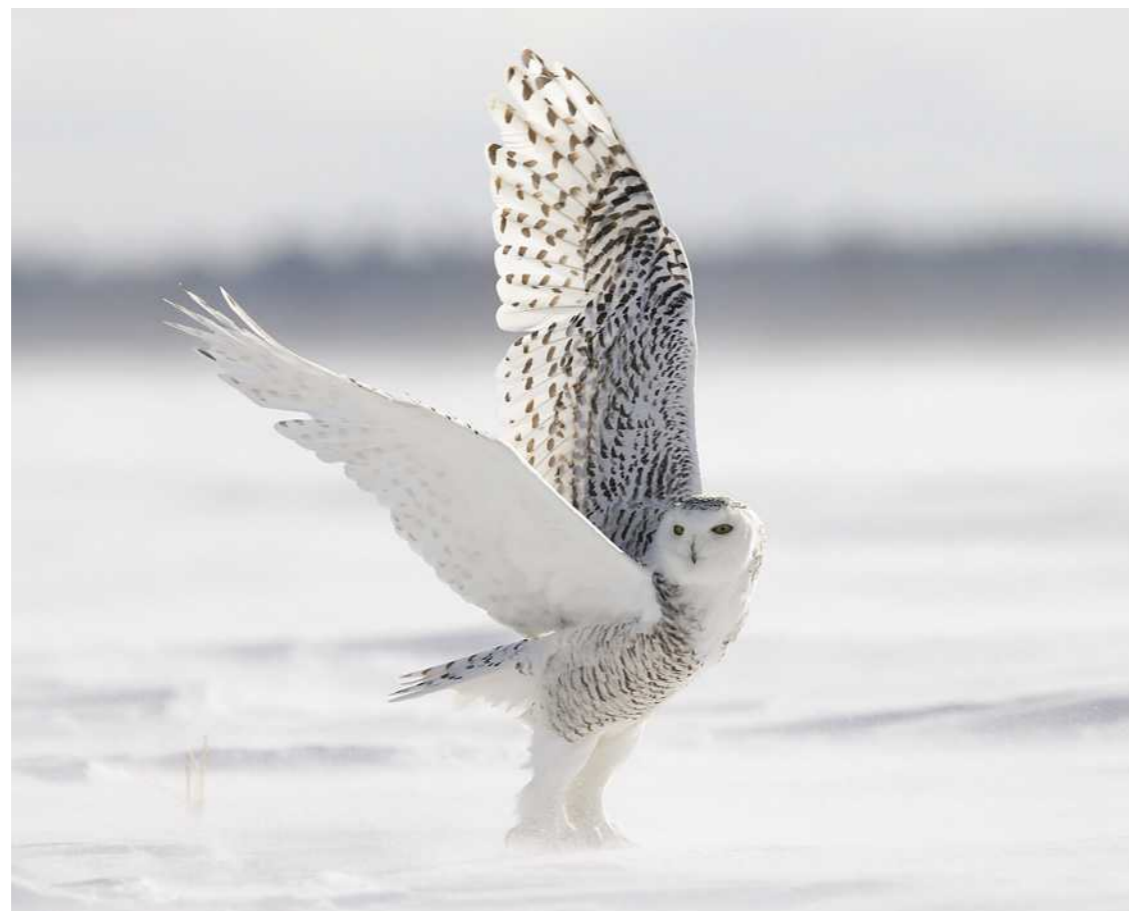
Canada. « Le harfang des neiges est un oiseau dont l'envergure peut atteindre 1,80 m ! Son plumage est plus blanc en hiver pour mieux se camoufler dans la neige. L'hiver dernier, j'ai passé 2 semaines à pister et à photographier ces oiseaux, allongé dans la neige, parfois par -25 °C et en plein vent. »

Hémisphère Nord « Moitié » de la Terre située au-dessus de l'équateur. Envergure (ici) Largeur du bout d'une aile à l'autre.