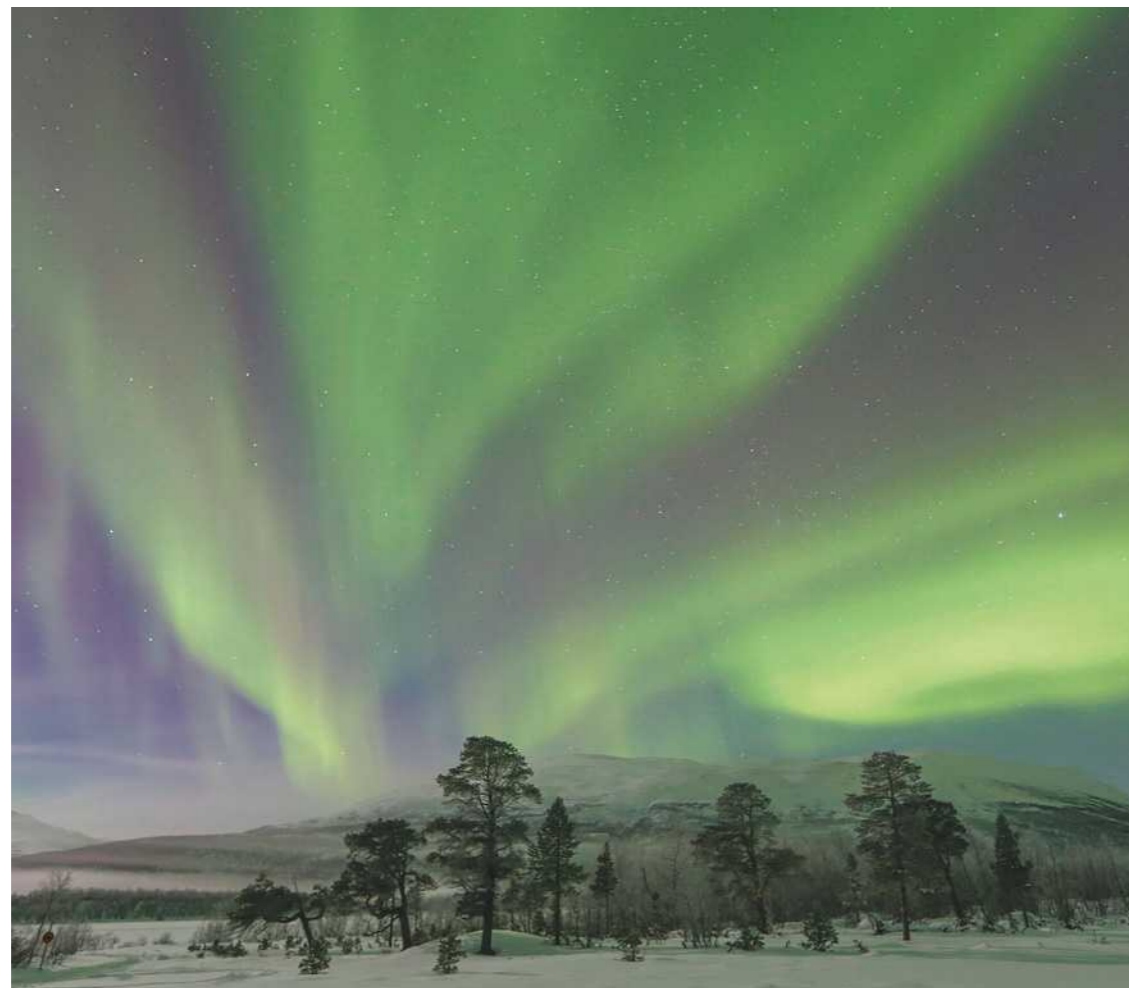
Nord de la Suède. « Dans cette région, le soleil reste invisible pendant 2 mois et demi. Durant les nuits d'hiver, le ciel s'illumine fréquemment d'aurores boréales (photo). Dans l'Antiquité, ces phénomènes étaient vus comme des serpents ou des dragons dans le ciel. »

Polaires | Michel Rawicki est allé en Antarctique, au Groenland, en Sibérie, en Alaska... Il a parcouru et photographié les régions polaires pendant plus de 20 ans, au cours de plus de 30 voyages.